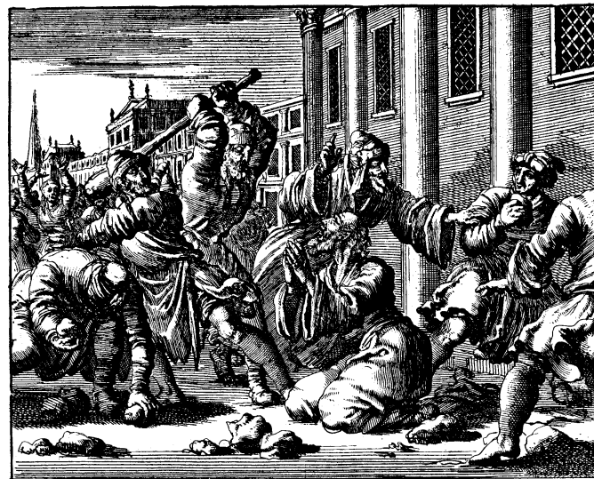
The Apostle James (the lesser) stoned and clubbed to death, Jerusalem, AD 63