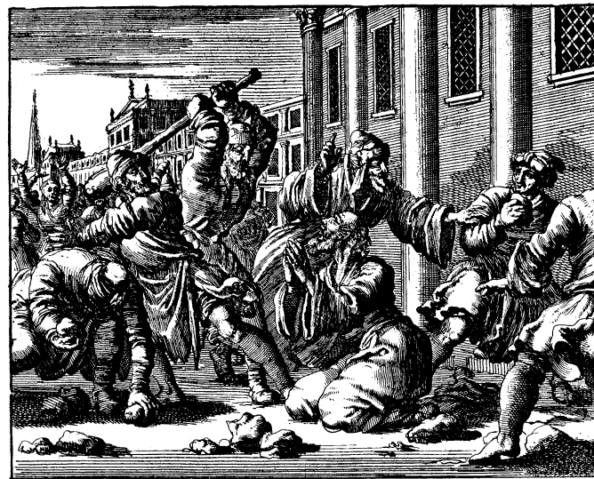
The Apostle James (the lesser) stoned and clubbed to death, Jerusalem, AD 63