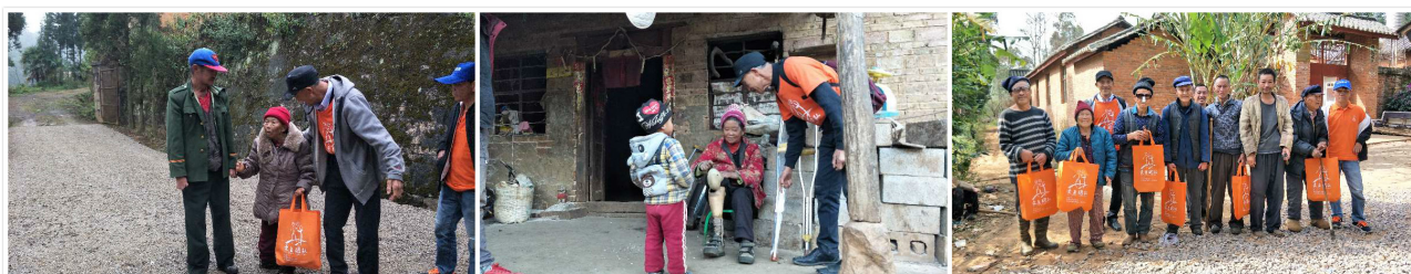
配送医疗包的图片

你奉献一个医疗包79.40元，可以为一位麻风病康复者提供半年所需的护理用品，你奉献两个医疗包158.80钱，可以为一位康复者提供一年所需的护理用品。在这方面我们我一年需要700个医疗包。在2018年我们依然缺乏700个医疗